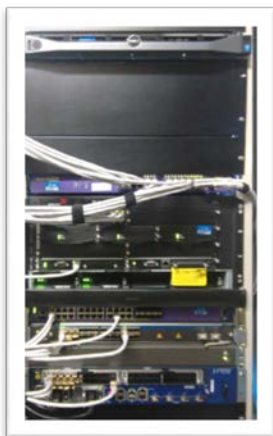
Rack LOFT. localizado no IDC

O LOFT (Laboratório OpenFlow para Testes de conformidade e desempenho) é parte integrante do projeto IDS da RNP. Localizado no IDC em Brasília, foi inicialmente criado com o objetivo de testar e homologar, de forma isenta e independente, equipamentos e controladores OpenFlow, em relação à conformidade com as diversas especificações OpenFlow, bem como avaliar a performance dos mesmos.